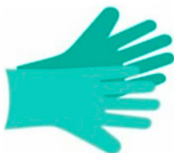
Guantes de nitrilo