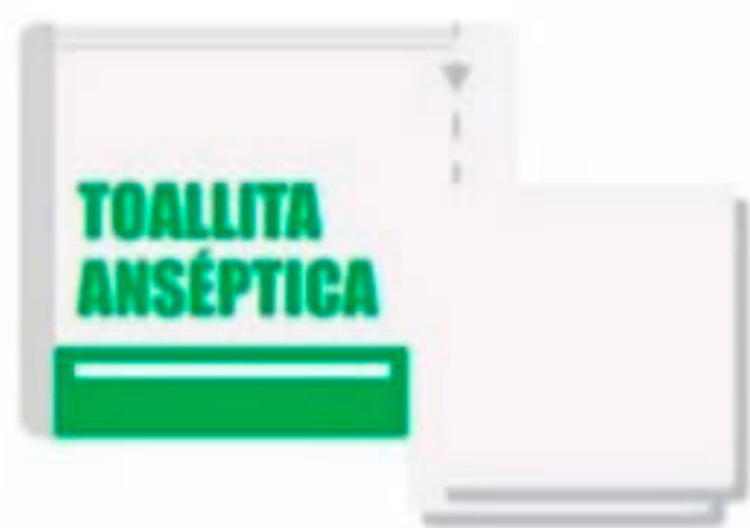
Toallitas de alcohol o desinfectantes