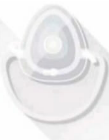
Mascarilla de protección